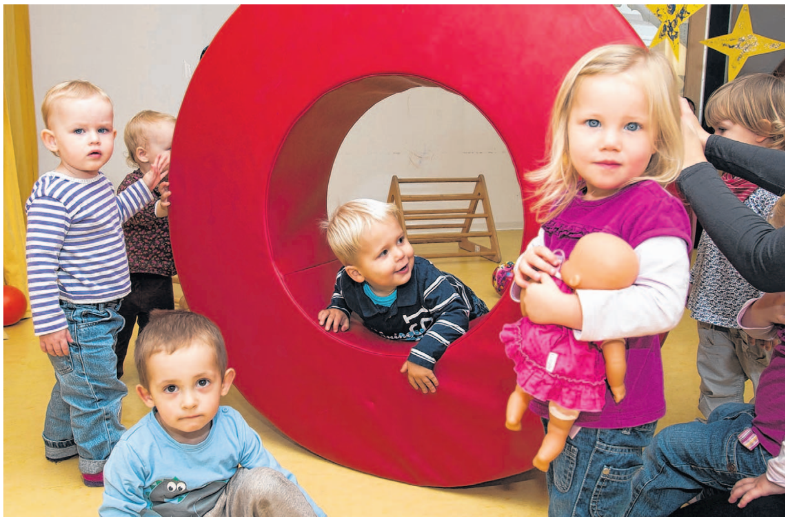
Nicht nur die BASF baut bei „LuKids“ (Bild) ihre Kinderbetreuung aus. Auch die Stadt und die freien Träger wollen ihre Einrichtungen erweitern.

Hinweise an die Polizei unter Telefon 0621/963-1163